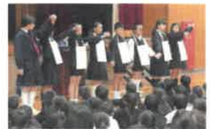
いじめゼロの児童会発表