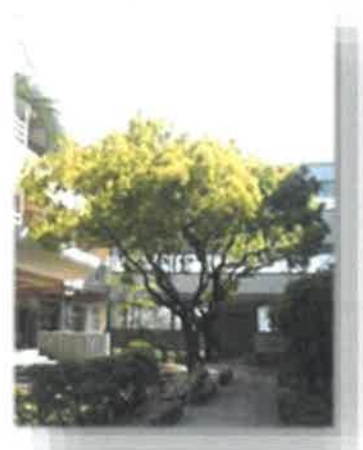
▲ 学校のシンボル — くすのき —