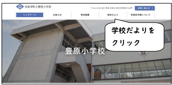
【ホームページのトップ】