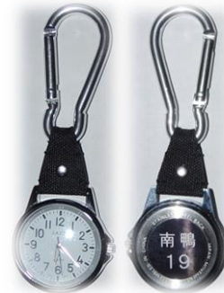
時計の裏には班のプレートが

集合場所に時計を設置して下さっている所もあり、家を出る時や出発する時の時刻はわかっているけれども、登校中は誰かに訊く以外に時刻を知る術はほとんどありません。