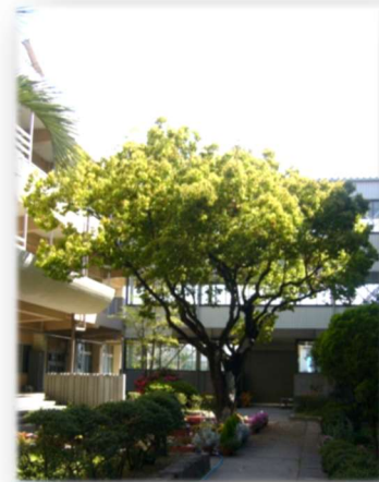
▲ 学校のシンボル — くすのき —